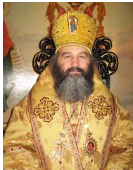
Преосвященнейший АГАПИТ, епископ Северодонецкий и Старобельский

Прежде всего, Православие — это люди. Правящий епископ Агапит является добрым пастырем, под руководством которого собраны прекрасные талантливые люди. Он установил жизнь молодой епархии, создал чудес-