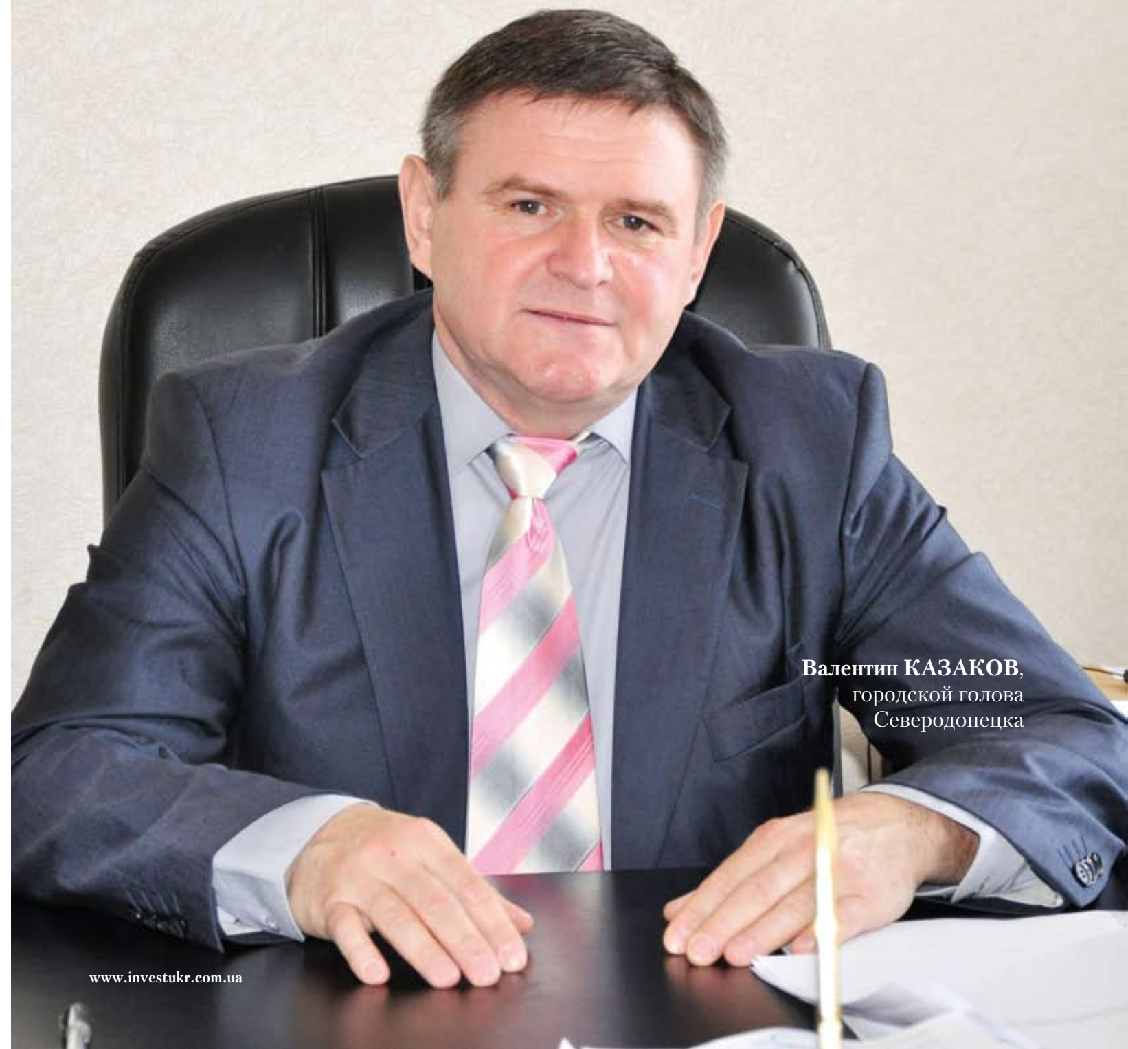
Валентин КАЗАКОВ, городской голова Северодонецка